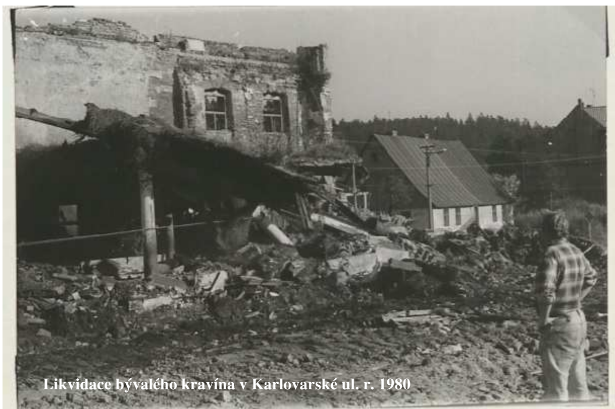
Likvidace bývalého kravína v Karlovarské ul. r. 1980

Fotoalbum-obrazový archiv III. Historie obce Pernink