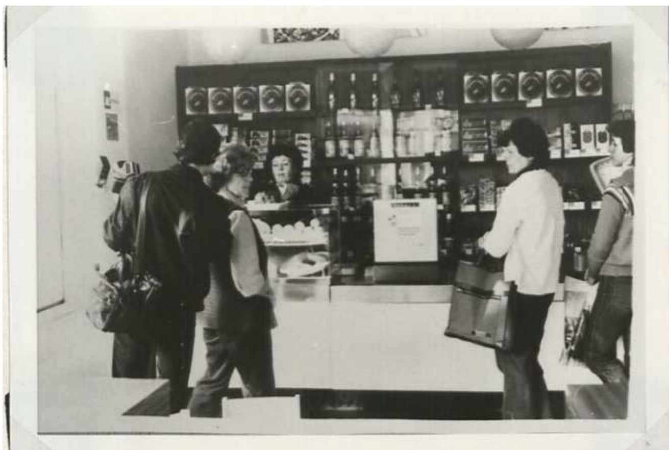
První dny prodeje