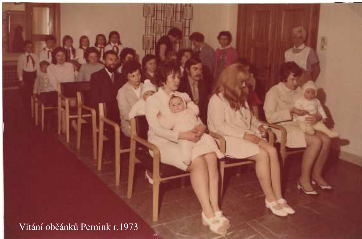
Vítání občánků Pernink r.1973

To by bylo pro toto vydání vše a příště budeme pokračovat rokem 1984 a dále. Na úplný závěr uvádím jednu úsměvnou zajímavost z okruhu požární jednotky naší obce. V časopisu Požární ochrana z roku 1967 vyšel v textu uvedený článek.