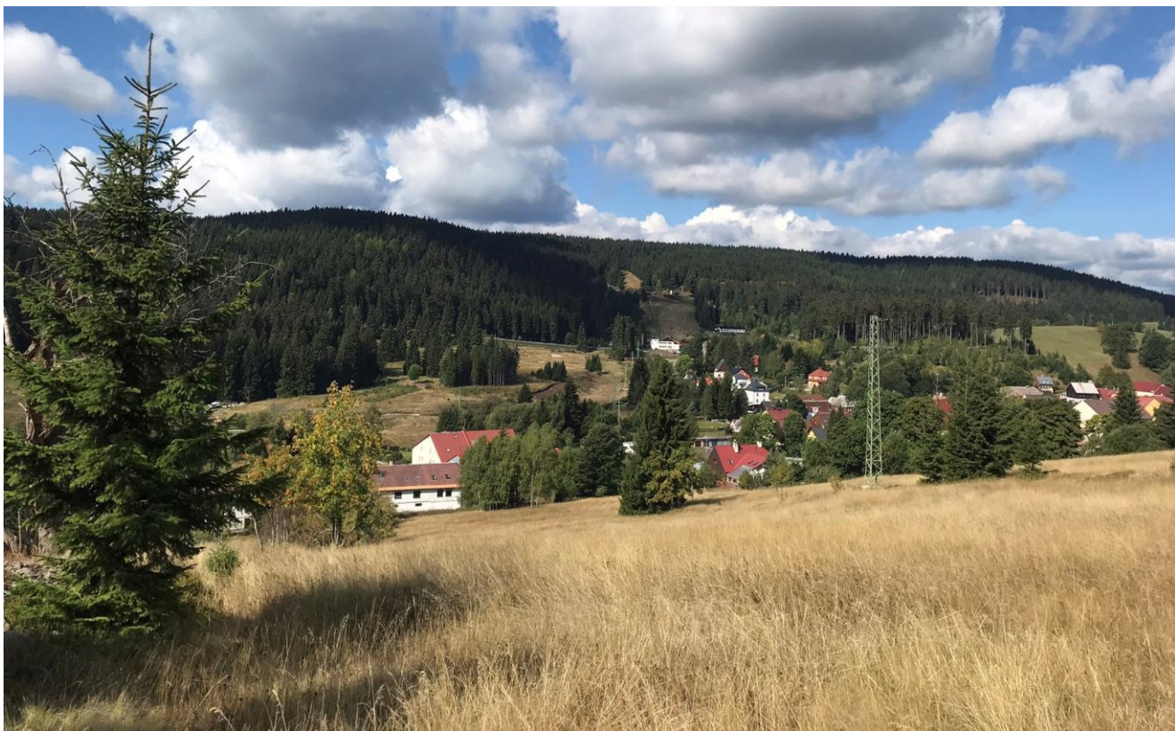
Pernink - pohled od laviček