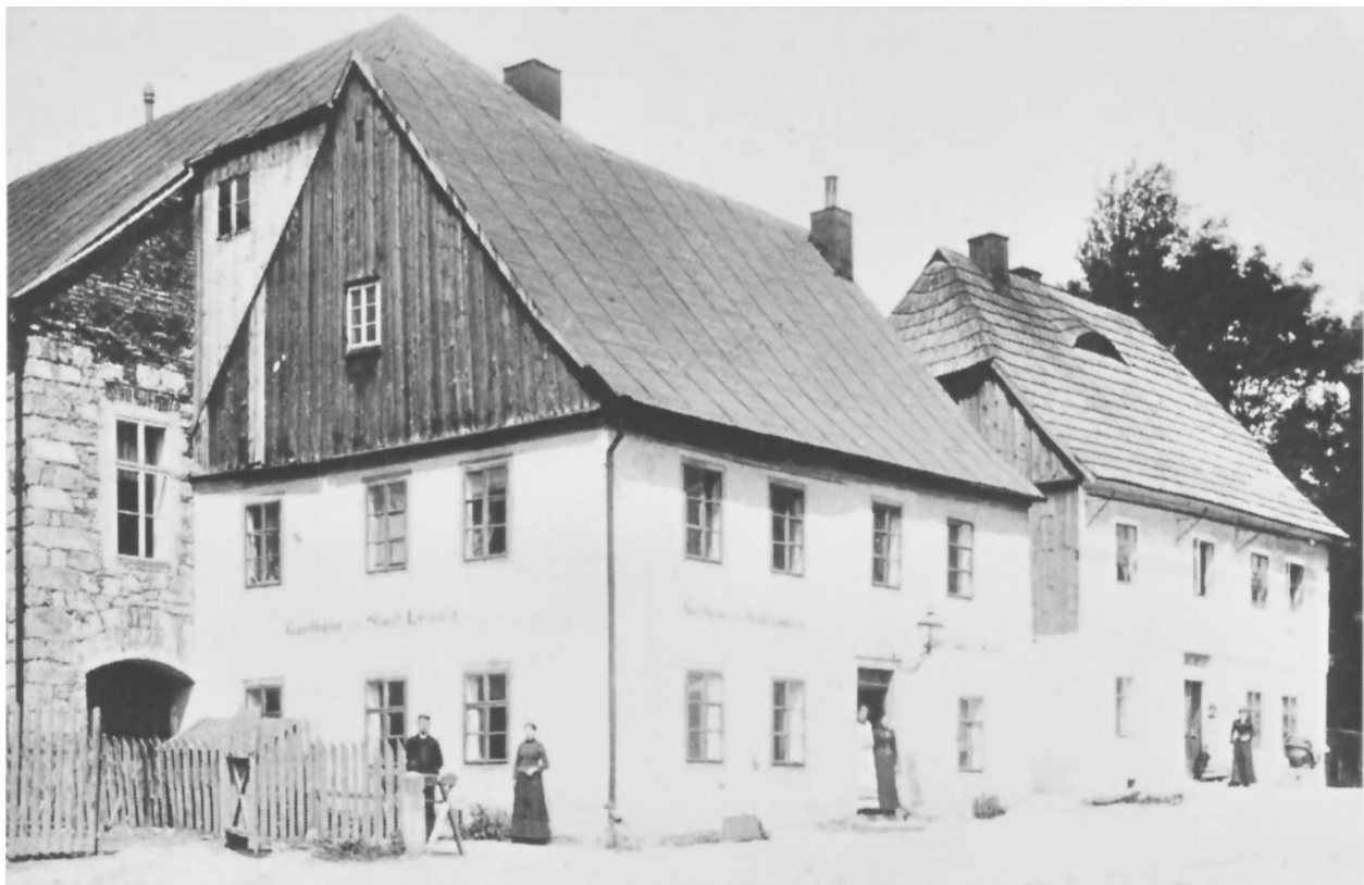
Foto restaurace Plzeňka v T. G. Masaryka přibližně rok 1918 a současnost