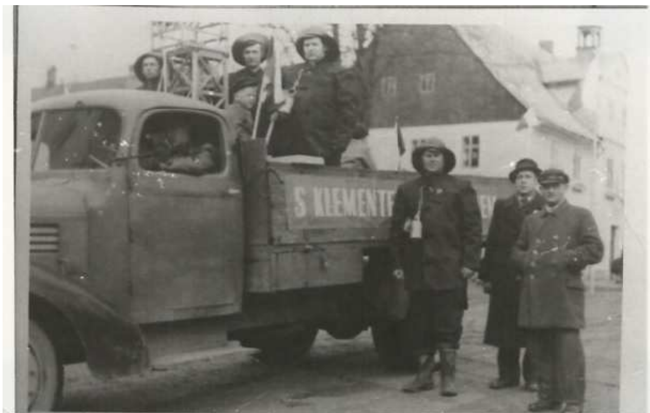
Oslavy 1. máje 1948

Použitá literatura: KRONIKA PERNINSKÁ KNIHA PRVNÍ -1988 str.62-69, KRONIKA PERNINSKÁ KNIHA DRUHÁ od roku 1988 str.154-155, Fotoalbum – obrazový archiv III. Historie obce Pernink