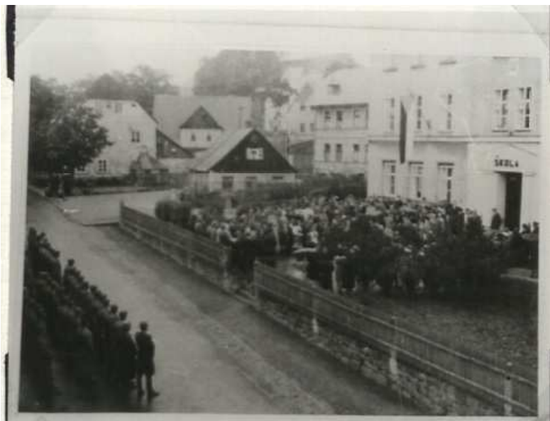
Září 1945- slavnostní otevření školy za účasti jednotky čs.armády

V říjnu 1948 byly ve střední škole zavedeny kroužky matematiky, jazyka českého a ruského, dále pak zájmové kroužky pro tělovýchovu a brannost, hudbu a zpěv.