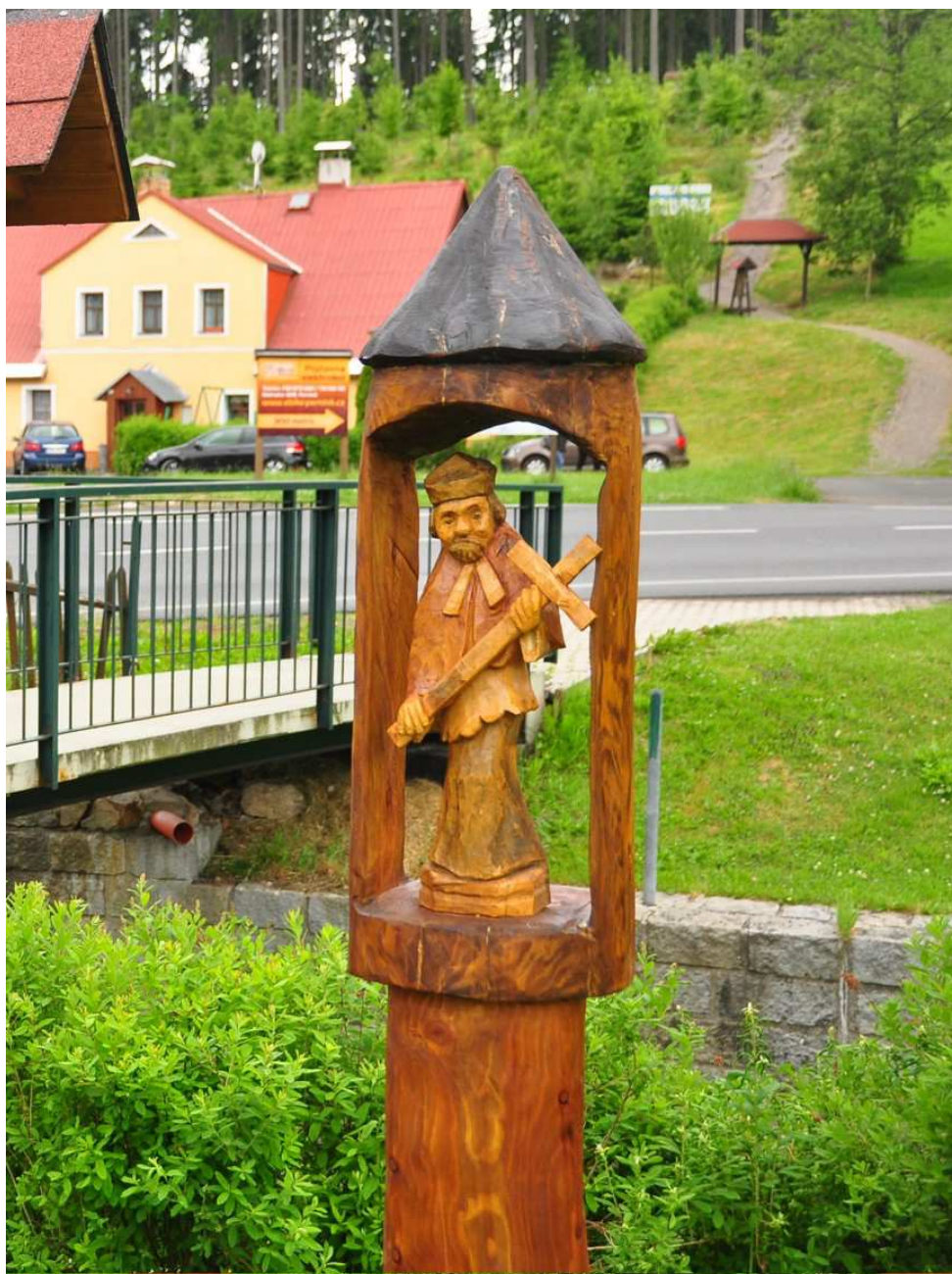
Socha sv. Jana Nepomuckého v parku naproti Obecnímu úřadu