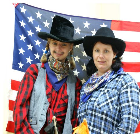
USA kovbojská jízda na koních