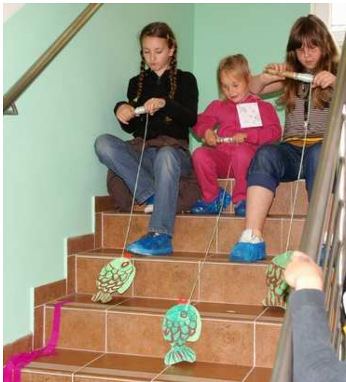
Chytání ryb v Grónsku

Téměř 90 dětí absolvovalo Cestu kolem světa, navštívily země známé i méně známé, v jednotlivých zemích plnily úkoly a soutěže, které pro ně připravily učitelé z naší základní školy a mateřské školy, zástupci obce a TJ Sokol Pernink, hasiči a také rodiče našich nejmenších. Jednotlivá stanoviště byla rozmístěna po celé Krušnohorce a pokračovala spojovací chodbou až do školy. Nechyběl ani hudební doprovod, karaoke a občerstvovací stanice ve stanu na hřišti vedle tělocvičny – s buřtíky a limonádou. Na běžeckém kolečku bylo pro děti připraveno také velmi zajímavé stanoviště, kde by děti mohly pod dohledem místních horolezců šplhat po stromech a slaňovat, to se ale bohužel do komunitního centra přesunout nedalo.