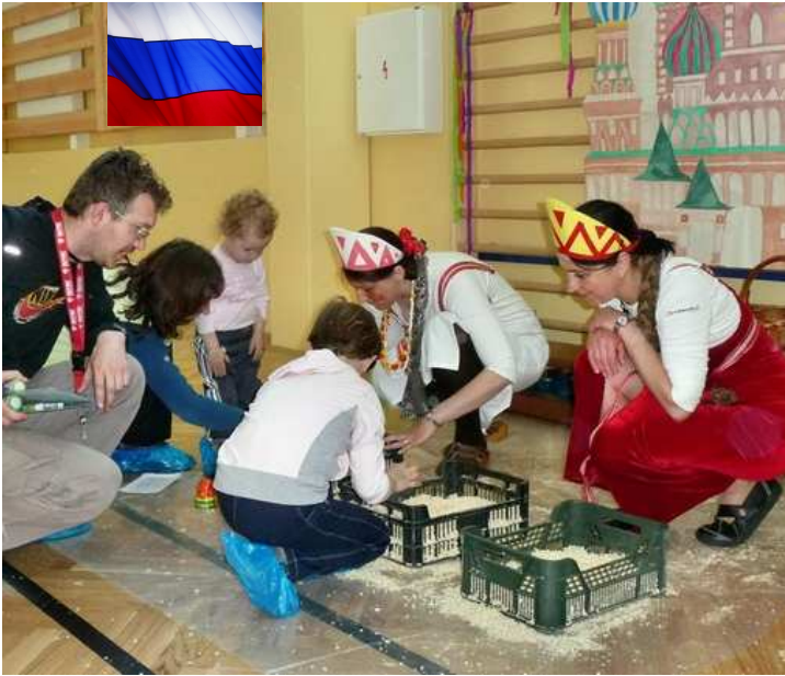
Rusko - hledání a sestavování bábušek