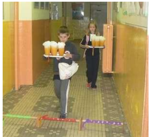
Německo – nošení piva