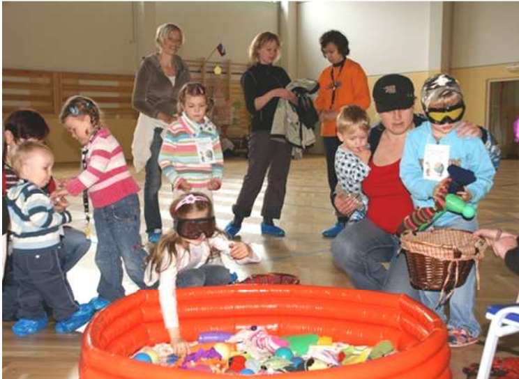
Španělsko – lovení langust v moři